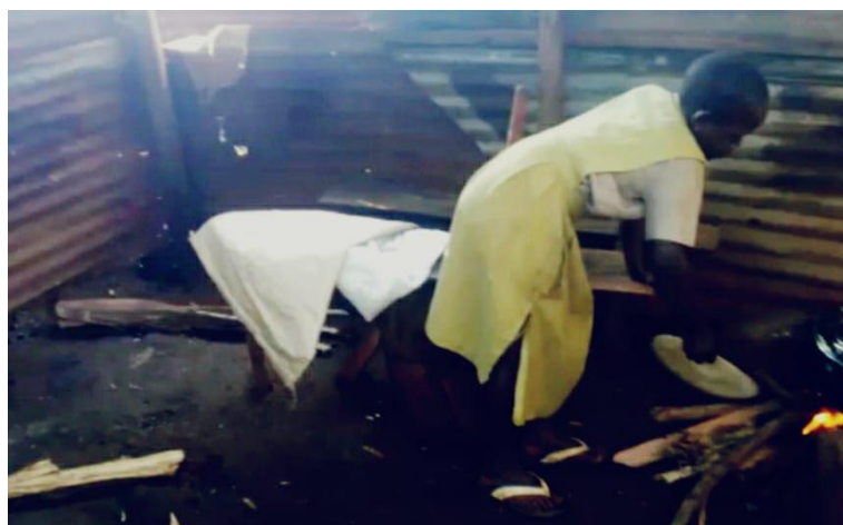
Arriba: Imágenes de la recogida manual de agua y de la precaria “cocina”

Es natural pensar que, a las muchas diarias necesidades del Hogar, se le suma ahora esta urgencia de tener que comprar sin contar con el capital necesario. Por lo antes detallado, cualquier importe, ya sea puntual o periódico, es de mucha ayuda para ellos.