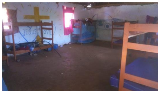
Imágenes del solar y de la nave dormitorio